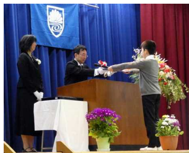
卒業証書授与(卒業式にて)