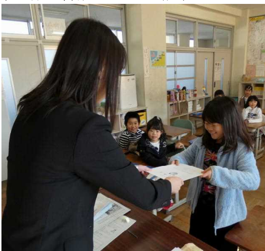
「あしあと」手渡す担任 (写真は2学期終業式)

明日からは、 春休み になります。3月中に、学習用品や教科書、ノートの使うもの、使わないものの整理をして、4月から始まる新しい学年の学習がスムーズにスタートできるようにお願いします。なお、1年・3年・5年生の教科書には 2年間使用 するものがありますのでご注意ください。(生活・図工・社会・保健・家庭などです。地図帳は456年で使います)